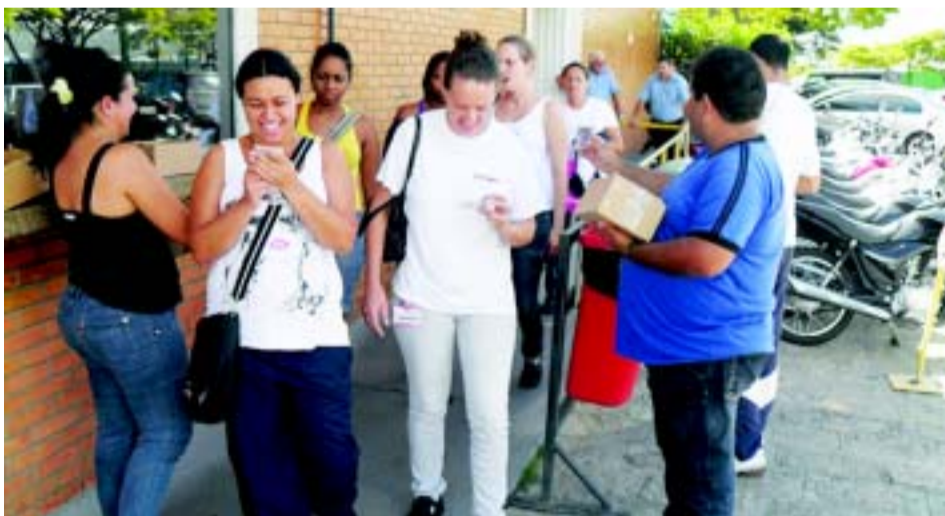
Homenagem ao Dia da Mulher

O Sindicato anuncia no mês de março os preparativos e inscrições para a participação dos associados (as) e dependentes na Festa do Dia do Trabalho. Neste mês a diretoria do Sindicato realiza a parceria com a Caixa Federal, Construtora Rio Branco e Prefeitura de Itu, para o Programa Minha Casa Minha Vida. O Deputado Carlos Grana toma posse na Assembleia Legislativa do Estado de São Paulo. Acontece no Camping Pantanal o 2º Torneiro de Pesca, e as mulheres são homenageadas com lembranças nas portas das fábricas.