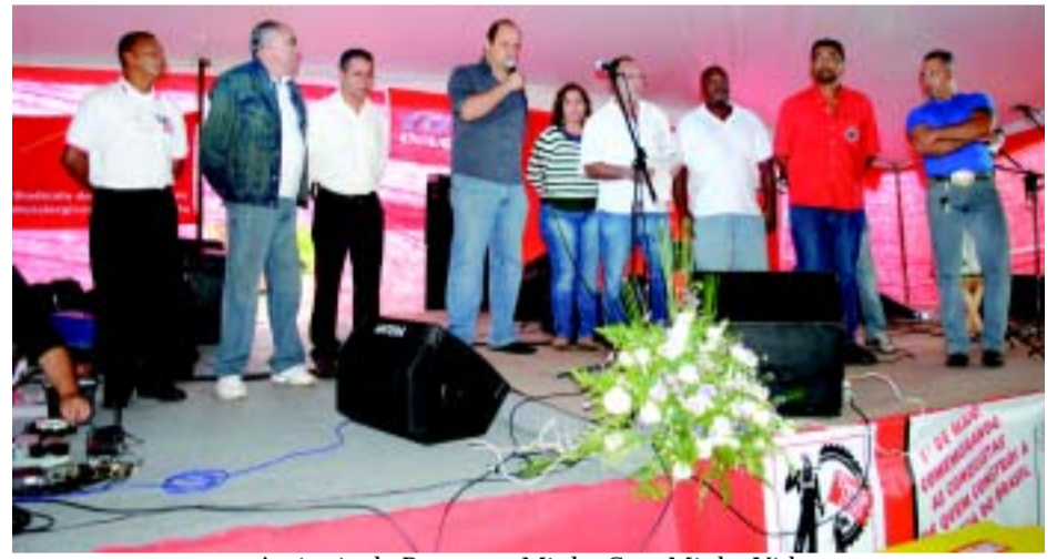
Anúncio do Programa Minha Casa Minha Vida

O mês de maio inicia com uma grande festa promovida pelo Sindicato e realizada no CRM, para celebrar o Dia do Trabalho. Mais de 2 mil pessoas estiveram presentes no evento. Na oportunidade foi lançado oficialmente o programa Minha Casa Minha Vida, com a presença do gerente da Caixa Federal de Itu e da Construtora Rio Branco. Ainda no mês de maio, foi inaugurado o Centro de Qualificação Profissional dos Trabalhadores, em parceria com a Tangram Social.