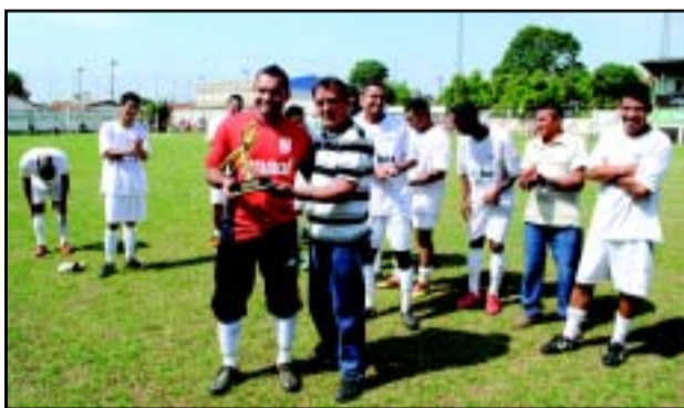
Defesa menos vazada - equipe Knnurr