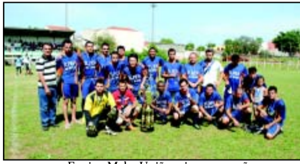
Equipe Mabe União - vice campeã