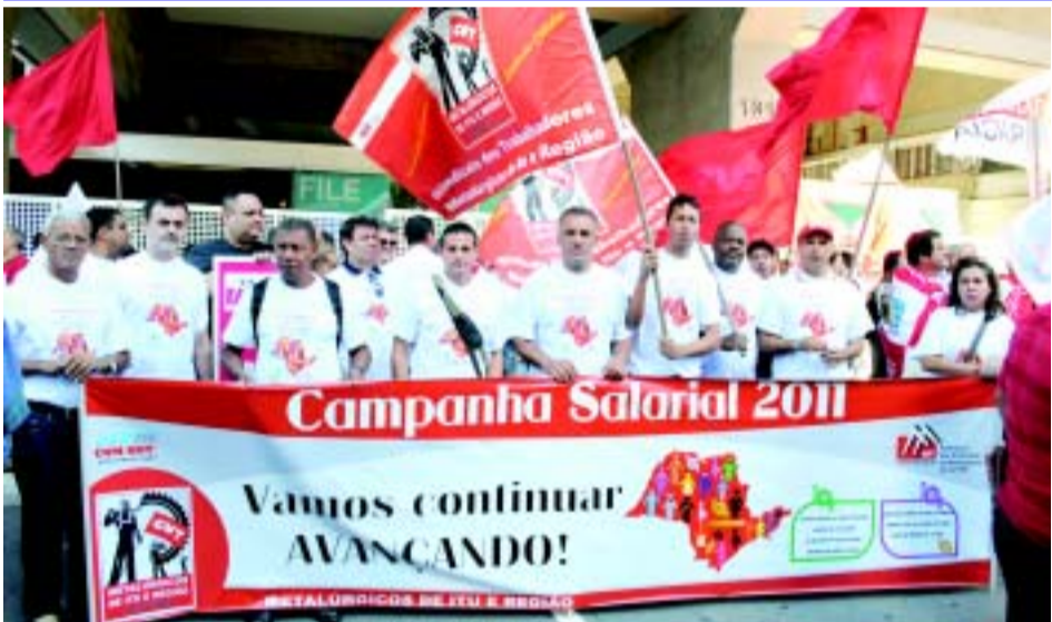
Ato de entrega da pauta na Av. Paulista

A Campanha Salarial 2011 começa com muitas palavras de ordem, dentre elas o clamor por aumento real, reposição da inflação e o avanço das cláusulas sociais. Um grande ato na Avenida Paulista em São Paulo, em frente da FIESP é realizado. Centenas de metalúrgicos participam, e entregam a pauta da Campanha.