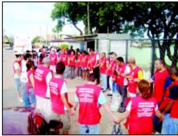
Início da arrecadação - Vila Martins

Desde os dias 12 de novembro, os dirigentes sindicais, membros das entidades e voluntários estão percorrendo as ruas dos bairros de Itu e Cabreúva arrecadando alimentos, onde já foram doados mais de 10 mil quilos de alimentos. A Campanha Natal sem