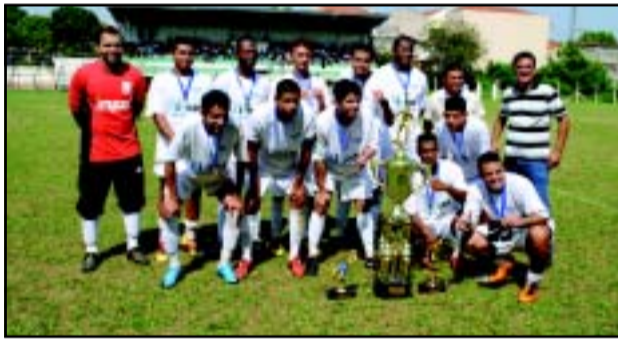
Equipe Knnurr - campeã

Participaram do 5º Festival de Campo dos Metalúrgicos de Itu e Região 13 equipes, onde foram realizados 12 jogos com 72 gols.