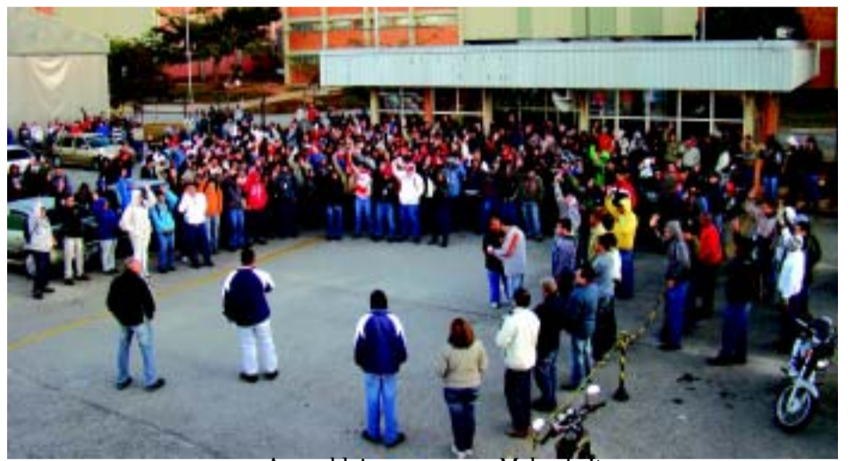
Assembleia na empresa Mabe de Itu

Apesar do clima frio, as coisas ficam quentes na base metalúrgica. Negociações de PLR emperradas, atrasos e inúmeras reivindicações, fazem com que os trabalhadores e trabalhadoras cruzam os braços e deflagrem inúmeras paralisações, como aconteceu na empresa Mabe de Itu. Os presidentes dos sindicatos metalúrgicos filiados a FEM/CUT-SP, se reúnem para começarem a discutir a pauta de reivindicação da Campanha Salarial 2011.