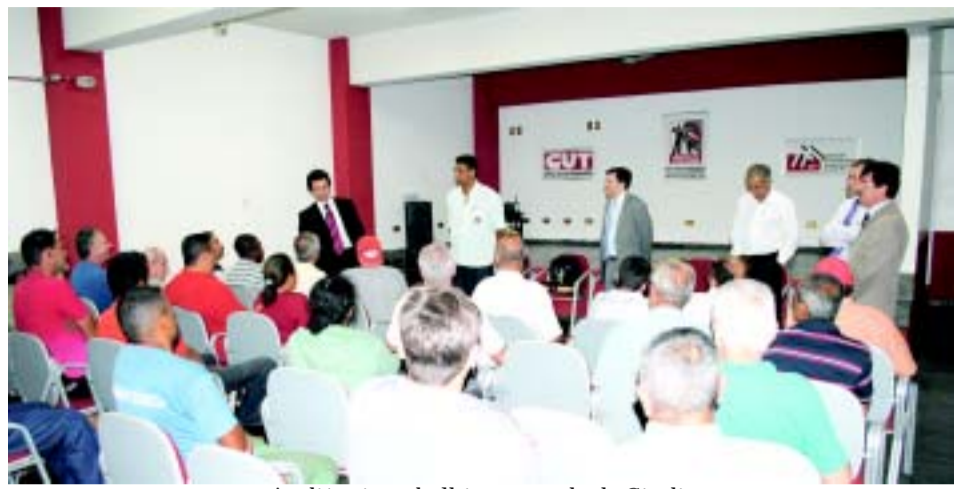
Audiência trabalhista na sede do Sindicato

Balanco da direção do Sindicato aponta que mais de 70% das empresas aderiram aos acordos da Campanha Salarial 2011. Acontece a 13ª Plenária da CUT onde foram reforçadas as bandeiras de lutas da classe trabalhadora. Pela primeira vez na história do Sindicato, aconteceu uma audiência de conciliação na sede do Sindicato, entre trabalhadores e a empresa Worthington S.A, onde um Juiz da Vara do Trabalho realizou a audiência fora do gabinete e na presença de todos os trabalhadores. Esta audiência colocou fim a um processo de 20 anos de espera. Ainda no mês de outubro, o Sindicato realizou a doação de brinquedos à Associação Amigos do Pira, para que fossem distribuídos às crianças da região da Cidade Nova.