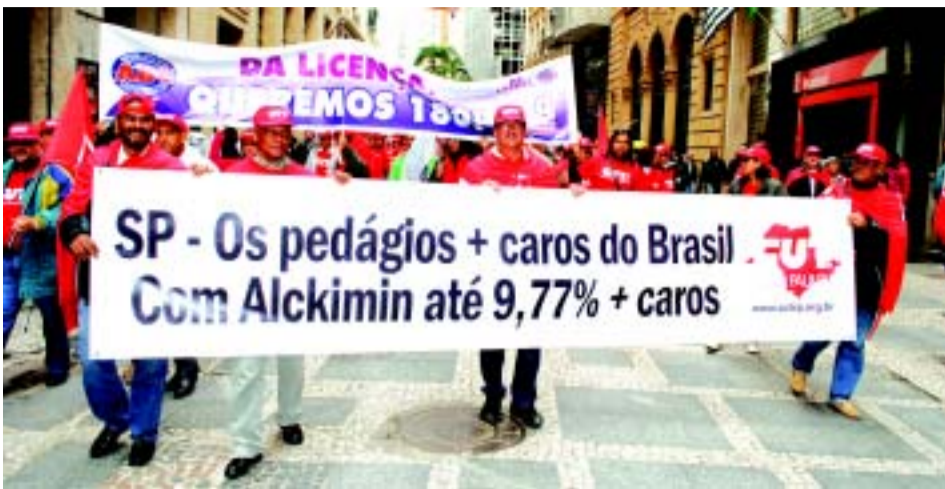
Metalúrgicos de Itu participando do ato no centro de São Paulo

Os rumos da Campanha Salarial são aprovados. Todos se organizam para o início da Campanha Salarial 2011. No início do mês, o movimento sindical cutista vermelha o centro de São Paulo, protestando inúmeras coisas, dentre elas o aumento abusivo dos pedágios. Os dirigentes dos Metalúrgicos de Itu e Região estiveram presentes ao ato e junto com os demais companheiros (as), pediram providências quanto ao assunto. Ainda no mês de julho, várias paralisações aconteceram, onde os trabalhadores pediram melhorias no local de emprego.