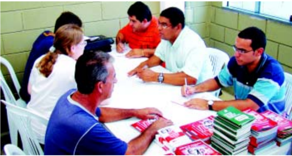
Sindicalização nas empresas de Boituva e Porto Feliz

No mês de fevereiro é anunciado a data do 6º Congresso dos Metalúrgicos da FEM / CUT- SP, também é entregue a família metalúrgica a revitalização do campo de futebol society. Houve a reunião para debater vários temas no Coletivo das Mulheres Metalúrgicas. O Sindicato intensifica o trabalho de sindicalização nas cidade de Boituva e Porto Feliz, levando os benefícios da entidade à vários trabalhadores (as) ainda não associados.