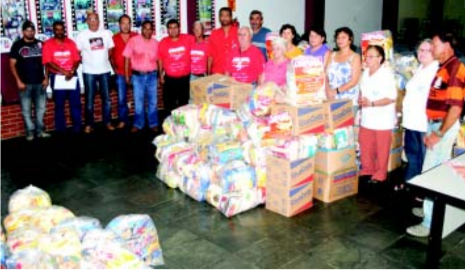
Entrega de alimentos da Campanha Natal Sem Fome 2010

O ano iniciou com muitos indicadores positivos. Pela primeira vez uma mulher chega a Presidência da República. O Boletim Metalúrgico foi à base ouvir a opinião dos metalúrgicos e metalúrgicas sobre as perspectivas do governo Dilma. Ainda em Janeiro, foi publicado o resultado da Campanha do Natal Sem Fome 2010, que arrecadou mais de 17 mil quilos de alimentos e o resultado do I Torneiro de Pesca dos Metalúrgicos de Itu e Região.