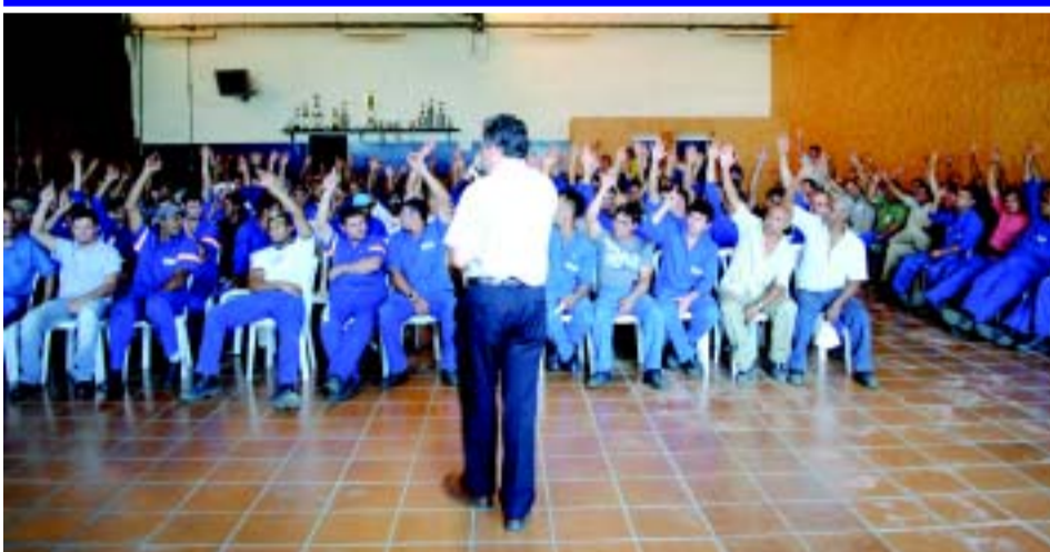
Assembleia de acordos por fábricas

As negociações com a bancada patronal não avançam, os metalúrgicos (as) de Itu e Região decidem em assembleia o Estado de Greve caso não chegue ao valor aprovado. O Sindicato abandona as negociações na bancada patronal e começa a fazer acordos da Campanha Salarial por empresas. Outro destaque do mês de setembro, é a participação do Sindicato na 1ª Feira de Profissões e Empregos, organizada e realizada pela Comissão Municipal de Empregos e a Secretaria de Educação.