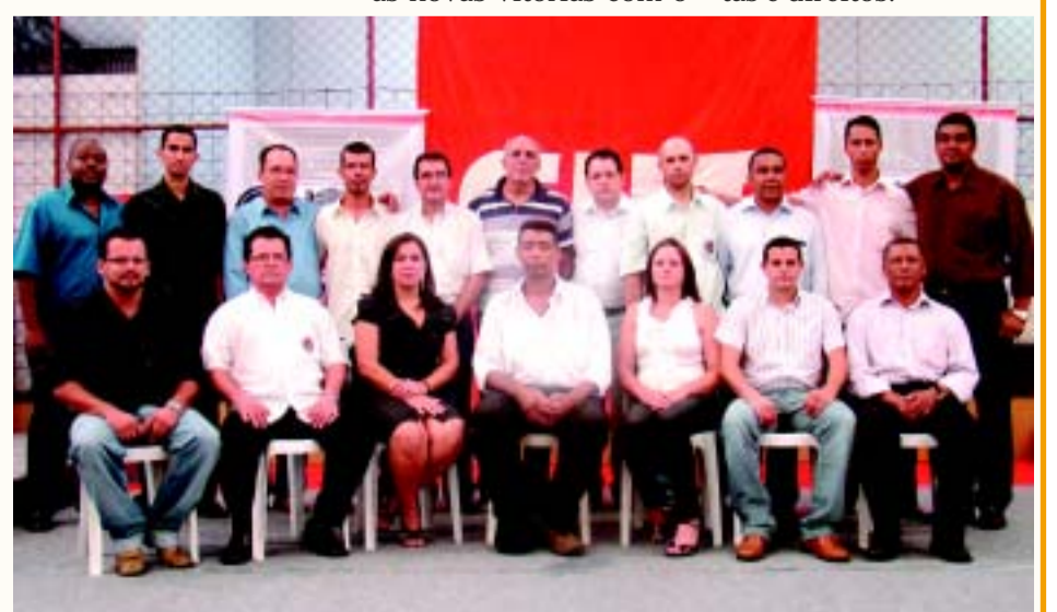
Diretoria do Sindicato dos Metalúrgicos de Itu e Região

Metalúrgicos e metalúrgicas, em 2012 vamos ampliar nossas conquistas e direitos.